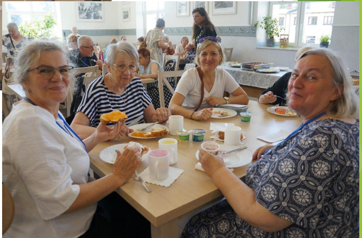
Pelplin i Warmia