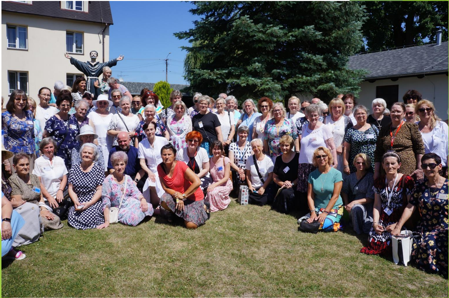
Jeszcze jedno grupowe zdjęcie na pamiątkę, aby każdy pamiętał spotkanie u Matki Bożej Niepokalanej, św. o Maksymiliana Kolbe i św. Franciszka.