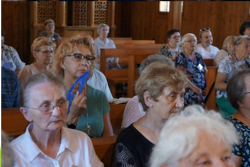
Eucharystia - kaplica św. o. Maksymiliana