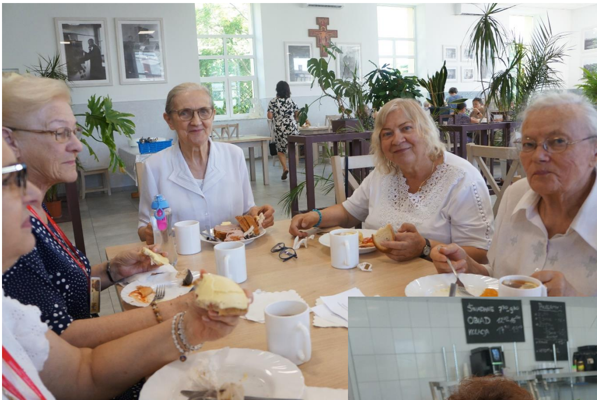
Śniadanko przy wspólnym stole - wdowy z diecezji toruńskiej i radomskiej